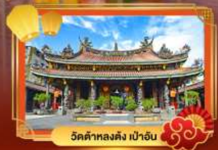
วัดต้าหลงตง เป่าอัน