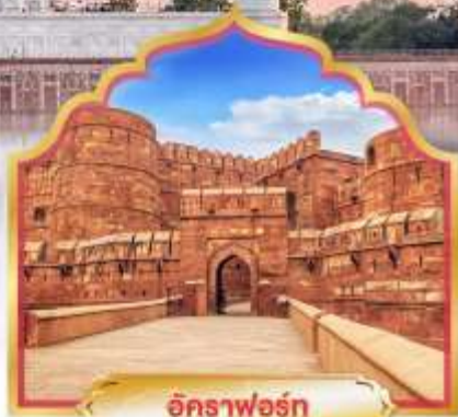
อัคราฟอรัท