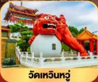
วัดเหวินหนู่