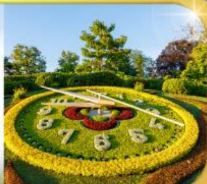
นาฬิกาดอกไม้เมืองเจนีวา