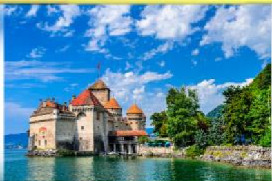
ปราสาทชิลยง