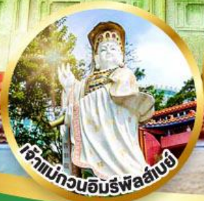
เจ้าแม่กวนอิมรพีลลัมเบย์