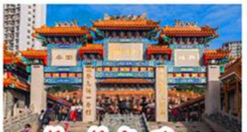
วัดเขว้งต้าเซียน

วัดเจ้าแม่กวนอิมฮ่องฮ่า - กระเชานองปิง พระใหญ่โป๊วหลิน - เจ้าแม่กวนอิมรีพัลส์เบย์ วัดแชกงหมิว - วัดหวังต้าเซียน - วัดเจ้าแม่ทับทิม