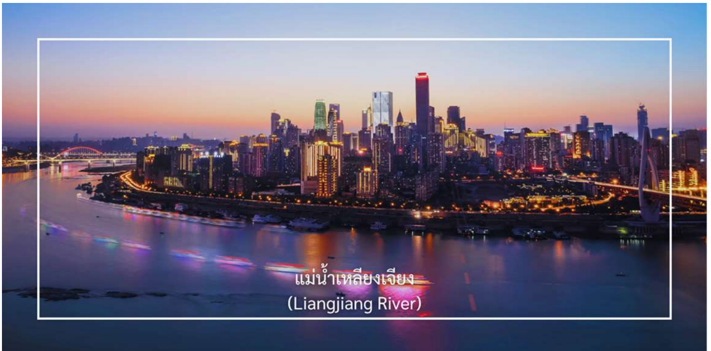
แม่น้ำเหลียงเจียง (Liangjiang River)

ล่องเรือม่านน้ำเหลียงเจียง (Liangjiang Cruise) พื้นที่จุดบรรจบของแม่น้ำทั้งสอง ซึ่งเป็นหนึ่งในมุมมองที่สวยงามที่สุดของเมืองฉงชิ่ง ซึ่งประกอบด้วย แม่น้ำแยงซี (Yangtze River) เป็นแม่น้ำสายที่ยาวที่สุดในจีน และเป็นสายหลัก แม่น้ำเจียงหลิง (Jialing River) แม่น้ำสาขาที่สำคัญซึ่งไหลลงสู่แม่น้ำแยงซี พื้นที่ที่แม่น้ำทั้งสองสายนี้มาบรรจบกันมีชื่อว่า “เหลียงเจียง” กิจกรรมล่องเรือสองแม่น้ำ (Two Rivers Cruise) ซึ่งได้รับความนิยม เพราะจะได้ชมเส้นขอบฟ้าของฉงชิ่งยามค่ำ คิน ตีกระฟ้า แสงไฟเมือง เป็นเอกลักษณ์