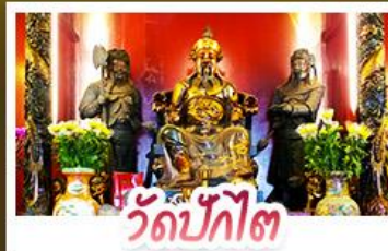
วัดปักไต่