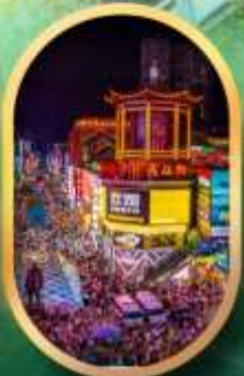
ถนนคนเดินซิงสวี่