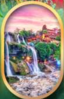
ฟูหลงเจินน้ำตก