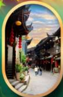
เมืองโบราณฟูหลงเจิน