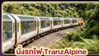
นั่งรถไฟ TranzAlpine