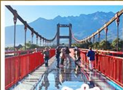
สะพานแก้วลี้เจียง