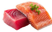
● ไส้ทานปลาดิบ