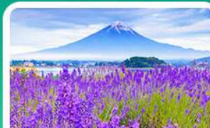
สวนโออิชิปาร์ก