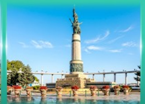
อนุสาวรีย์มังกร