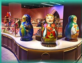
พิพิธภัณฑ์ ตุ๊กตาเป่ลุดก