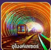
อุโมงค์เตาเซอ