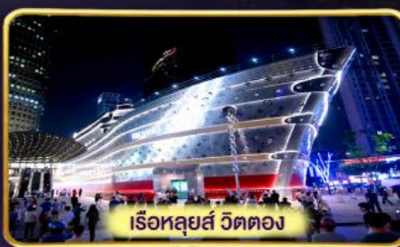
เรือหลุยส์ วัดตอง