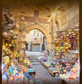
ตลาดงานอเล็กซานเดรีย