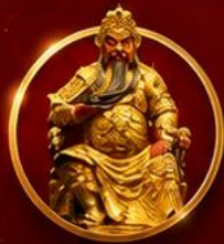
ขอพรเทพเจ้ากวนอู

เปิดดวงเศรษฐี เสริมดวงจួយี่ใต้หวัน ขอพรเทพกวนอู รับพลังบารมีเจ้าแม่มาจู่ 4 วัน 3 คืน