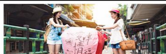
ปล่อยโดมลอยซื้อก๊ฟ