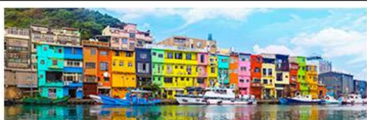
หมู่บ้านหลากสี ZHENGBIN

18 - 21 ก.ค. 69 | 12 - 15 ก.ย. 69 15 - 18 ส.ค. 69 | 28 - 31 ต.ค. 69