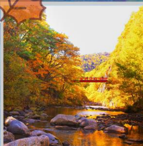
"JOZANKEI FUTAMI BRIDGE"