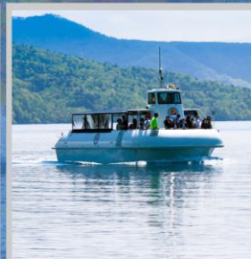
"LAKE SHIKOTSU GLASS BOAT"