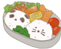
● อาหารสำหรับเด็ก ( 2-11 ปี ) * วัตถุประสงค์ขึ้นอยู่กับทาว์ราน