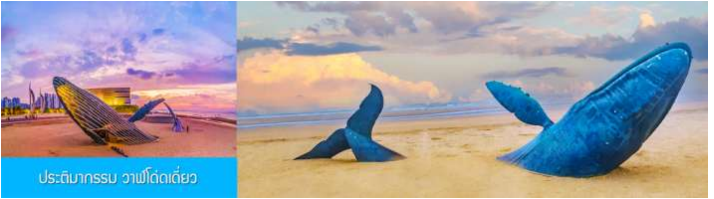
ประติมากรรม วาฬโด้เดี่ยว

นำท่านถ่ายภาพสุดสร้างสรรค์ที่ประติมากรรม วาฬเกยตื้น หรือวาฬโด้เดี่ยว 孤独的鲸 วาฬยักษ์ตัวนี้กำลังกระโดดขึ้นจากทะเล ซ่อนตัวอยู่ท่ามกลางทะเลป้อให้สับสนวุ่นวาย เป็นจุดถ่ายภาพยอดนิยมในช่วงน้ำลง ให้ท่านได้เก็บภาพ จุดไฮไลท์เป็นที่ระลึก