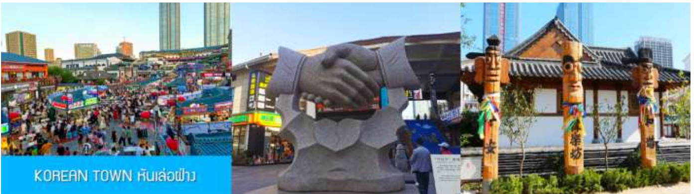
KOREAN TOWN หันเล่อฝาง