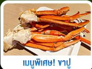
เมนูพิเศษ! ซาซิมิ