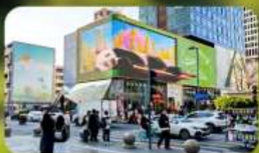
ไท่กุ่หลี่