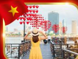
เช็กอินสะพานแห่งความรัก