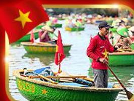
เรือกระด้ง หมู่บ้านกัมทาน