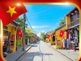
เมืองมรดกโลก ฮอยอัน