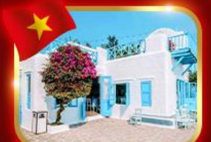
คาเฟ่สุดชิค ซานทรา มาริน่า