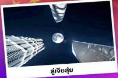
ดูเจ็ทสูย