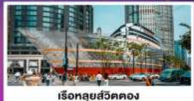
เรือหลุยส์วิตตอง