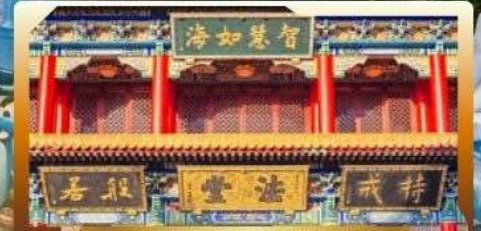
วัดจิ้งไต้