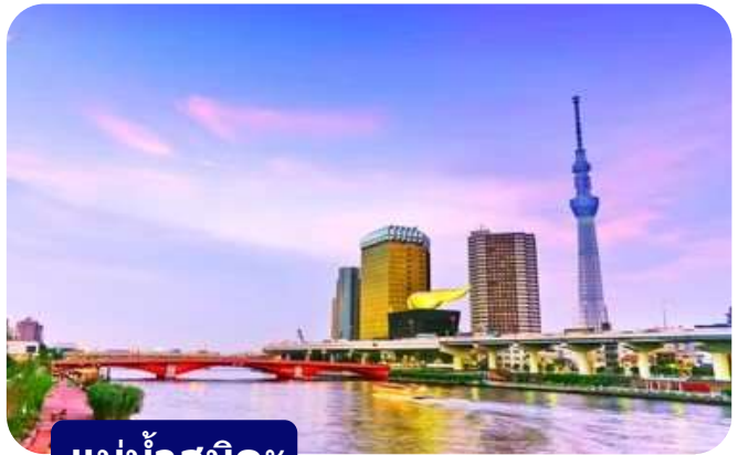
แม่น้ำสุมิดะ

ส่วนไฮไลต์สำคัญของวัดนี้คือ ไตคอน หรือหัวไข่เท้า สัญลักษณ์ศักดิ์สิทธิ์ คนที่นี่เชื่อว่าไตคอนช่วย "ชำระล้างสิ่งไม่ดี" และนำโชคลาภเข้ามา นักท่องเที่ยวมักนำไตคอนไปถวายเพื่อขอพร