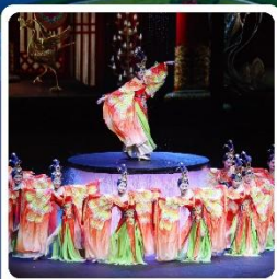
โชว์ FOSHAN QIANGQING