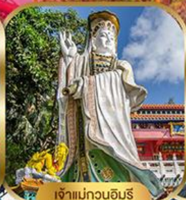
เจ้าแม่กวนอิมรีพลัสเบย์