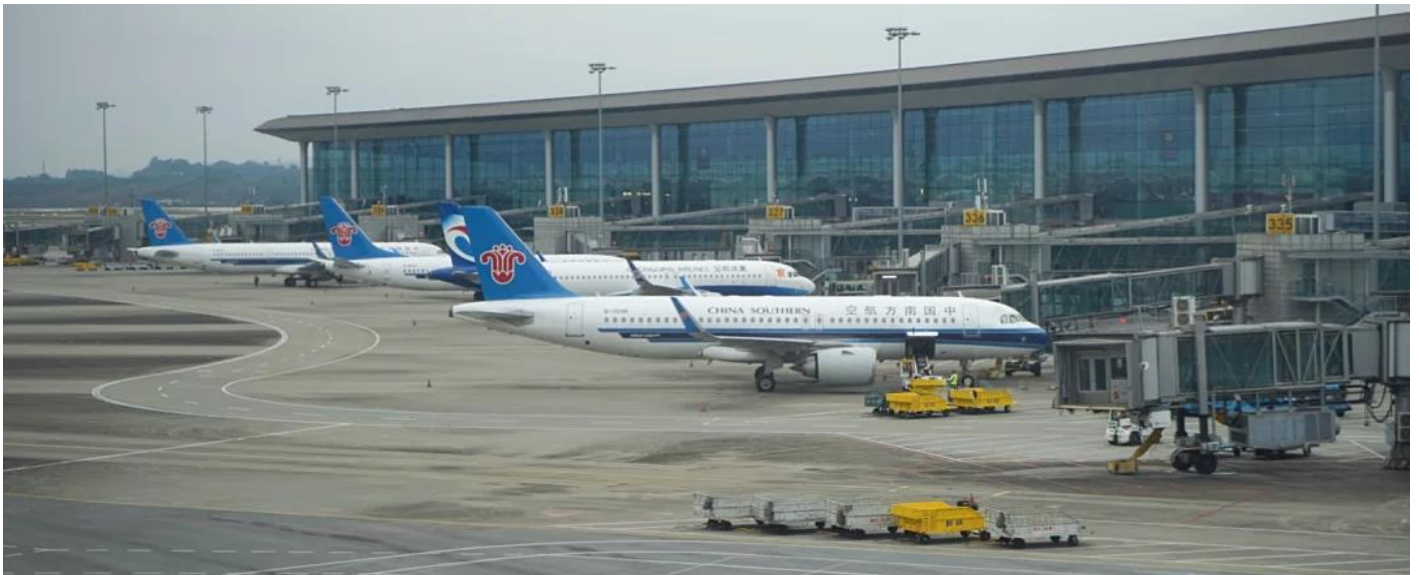
2UCKG-CZ005 บินตรงฉงชิ่ง ฟรีคอม ฟรีเดย์ สนุกสุดคุ้ม มหานครแปดมิติ 5 วัน 3 คืน โดยสายการบิน ไชน่า เซาเทิร์น (CZ)

00.30 น. ออกเดินทางจาก ท่าอากาศยานสุวรรณภูมิ อาคาร สู่ สนามบินฉงชิ่งเจียงเป่ย์ โดยสายการบิน ไชน่า เซาเทิร์น เที่ยวบินที่ CZ2362 05.00 น. เดินทางถึง ท่าอากาศยานนานาชาติสนามบินฉงชิ่ง เจียงเป่ย์ เมืองฉงชิ่ง มหานครที่ถูกสร้างขึ้นโดยทำหายทุกกฎเกณฑ์ของแรงโน้มถ่วงและภูมิศาสตร์ "เมืองภูเขา" ที่เติบโตและซ้อนทับกันเป็นชั้นๆ ตามหุบเขาและริมแม่น้ำ จนได้รับสมญานามสมัยใหม่ว่าเป็น "มหานคร 3 มิติสุดมหัศจรรย์" เมืองที่ท่านจะรู้สึกเหมือนหลุดเข้าไปในฉากภาพยนตร์ไซไฟ ที่ซึ่งชั้น 1 ของตึกหนึ่งอาจเชื่อมต่อกับชั้น 20 ของตึกข้างๆ, ที่ที่ท่านจะได้เห็นรถไฟฟ้าวิ่งทะลุกลางตึกอพาร์ทเมนต์, และที่ที่ Google Maps อาจต้องยอมแพ้ให้กับความซับซ้อนของถนนหนทางที่สร้างทับกันไปมาถึง 5 ระดับ จากนั้นนำท่านผ่านขั้นตอนตรวจคนเข้าเมือง รับกระเป๋าสัมภาระแล้ว นำท่านออกเดินทางเข้ารับประทานอาหารเช้า