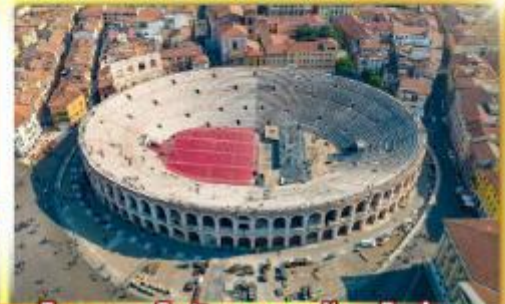
โรงละครโรมันกลางจัหวโรม่า