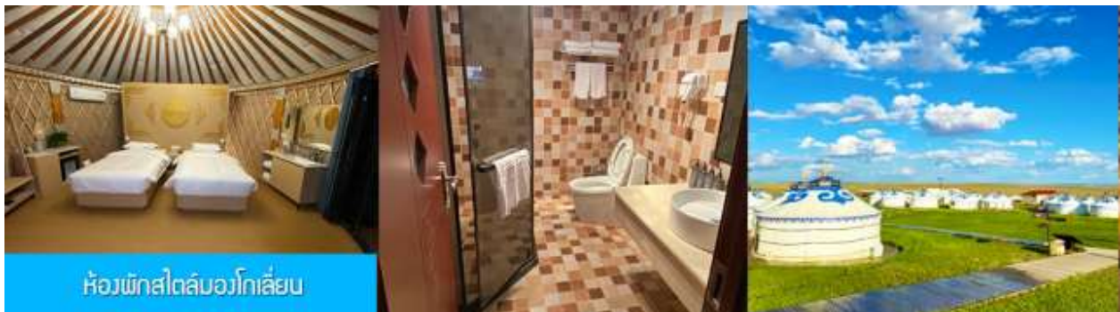
ห้องพักสไตล์บอวโกเลียน