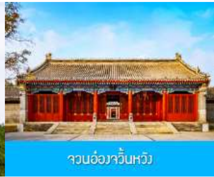
จวนอ๋องจวินหวัง

วันที่หก เมืองเออร์ดอส -อี้เค้ออ่าเป่า-พิพิธภัณฑ์เครื่องเงิน-จวนอ๋องจวินหวัง- สวนวัฒนธรรมหมงกู่หยวน หลิว-ซื้อปิ้งถนคนเดิน -บินกลับกรุงเทพฯ