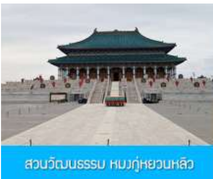
สวนวัฒนธรรมหมงกู่หยวนหลิว

หลังอาหารนำท่าน เที่ยวชม จวนอ๋องจวินหวัง 郡王府 จวนแห่งนี้เริ่มสร้างขึ้นในปี ค.ศ. 1902 สร้างเสร็จในปี ค.ศ. 1936 เป็นที่พำนักของ อ๋องอิฉิจวินหวัง 伊旗郡王 เป็นจวนอ๋องเพียงหนึ่งเดียวที่ได้รับการอนุรักษ์ในสภาพที่สมบูรณ์ โครงสร้างทำด้วยอิฐ หิน และไม้ ประกอบด้วยห้องพัก 16 ห้อง เป็นสถาปัตยกรรมผสมแบบมองโกล ทิเบต และฮั่น