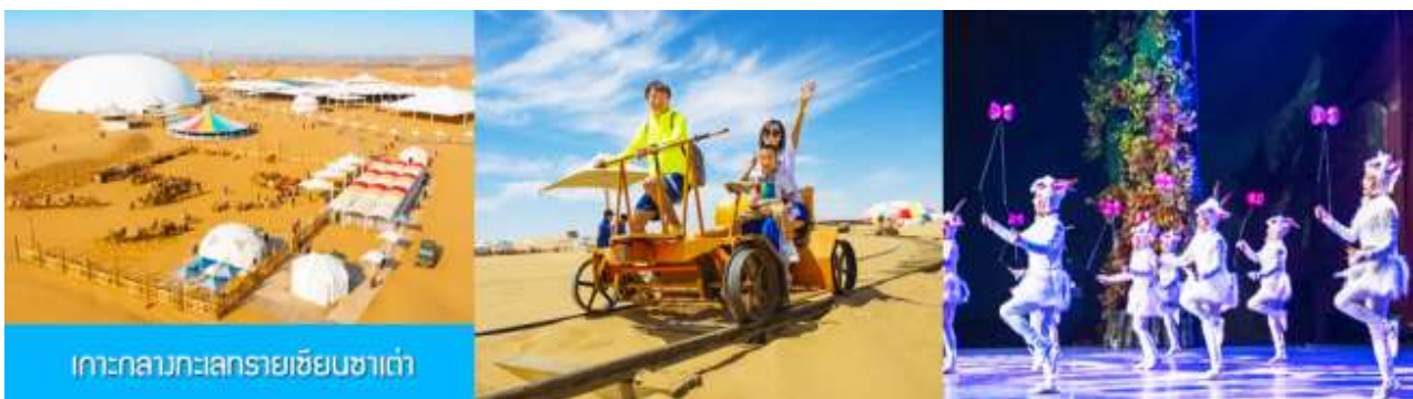
เกาะกลางทะเลทรายเขียนซาเต๋า