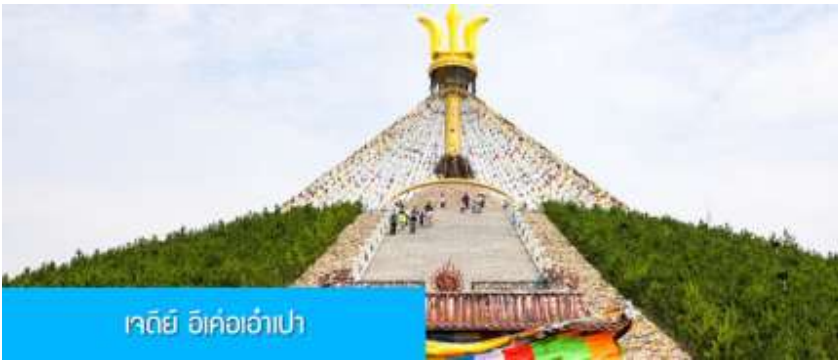
เจดีย์ อี้เค้ออ่าเป่า

พักที่ DALAETQI SHNAGJING HOTEL โรงแรมระดับ 4 ดาวหรือเทียบเท่าในเมืองต้าลาเท่อ