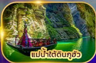
แม่น้ำใต้ดินกุ้ยโจว