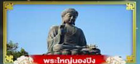
พระใหญ่ของปิง