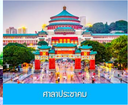
ศาลาประชาชน

วันที่สี่ อิสระ ฟรี 1 วัน (ไม่มีอาหารและรถบริการ)