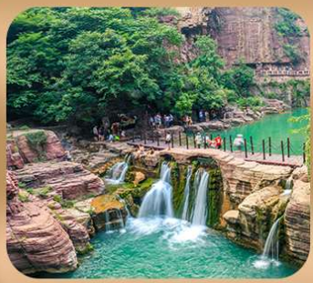
“อุทยานหยุนไท่ซาน”

ชมถ้ำหลงเหมิน มรดกโลกที่เมืองลั่วหยาง • สุสานจีนซีฮ่องเต้ • ศาลเจ้ากวนอู วัดเส้าหลิน + ป่าเจดีย์ + ชมโชว์กังฟู • เมืองโบราณลั่วอี้ • อุทยานหยุนไท่ซาน เจดีย์ห้าพันปี • ถนนวัฒนธรรมต้าถัง • ถนนคนเดินอิสลาม • จัตุรัสหออระขิง