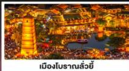
เมืองโบราณลั่วหยี่