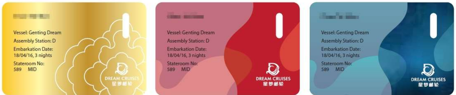
**รูปภาพด้านบนใช้เพื่ออ้างอิงรูปแบบการ์ดเท่านั้น** หากกรณีการ์ดสูญหายกรุณาติดต่อแจ้งทาง Reception