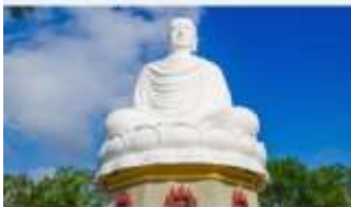
วัดลองเฮิน