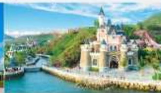
สวนสนุกวินวันเดอร์ส

*ทางบริษัทฯ ขอสงวนสิทธิ์ในการลงโปรแกรมทัวร์ตามความเหมาะสมขึ้นอยู่กับสถานการณ์ปัจจุบัน โดยทำถึงถึงผลประโยชน์ของลูกค้าเป็นสำคัญ