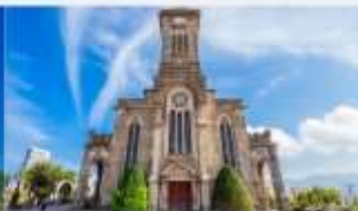
โบสถ์หินญาจาง