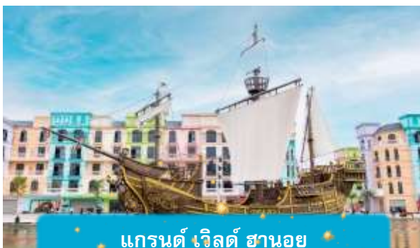
แกรนด์ เวิลด์ ฮานอย