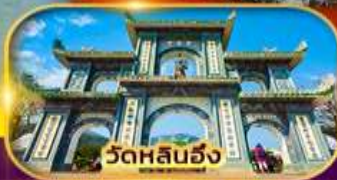
วัดหลันฮั่ง