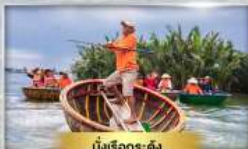
มังเรือกระดัง