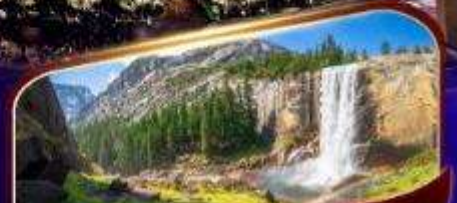
อุทยานแห่งชาติโยเซมิตี