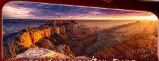
แกรนด์แคนยอนฝั่งตะวันตก

พักลาสเวกัส 2 คืน เต็มอิ่มกับแสงสีแห่งอเมริกา