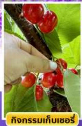
กิจกรรมเก็บเชอร์รี่