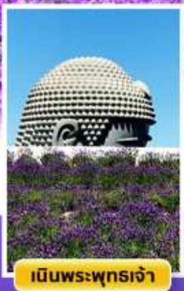
เจดีย์พระพุทธรเจ้า