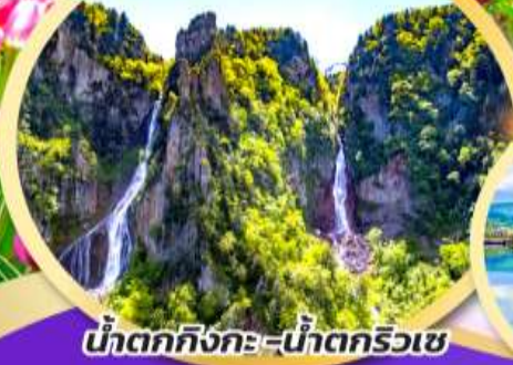
น้ำตกกิ่งกะ-น้ำตกริวเซ