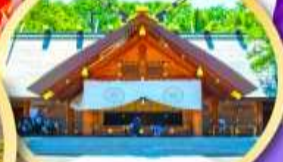
ศาลเจ้าออกโทโด