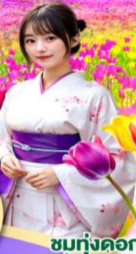
ชมทุ่งดอกชิบะ