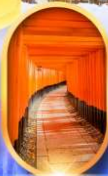
เมืองเก่าทาคายาม่า