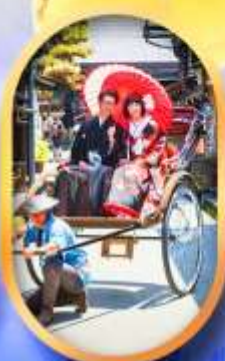
ศาลเจ้าจิ้งจอก