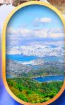
ทะเลสาบมิกะตะ