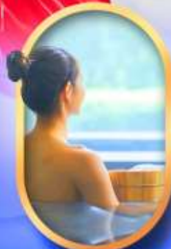
พักโรงแรมออนเซ็น