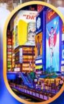
ย่านชิบโฮบาชิ