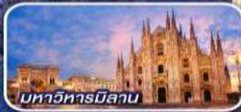
มหาวิหารมิลาน