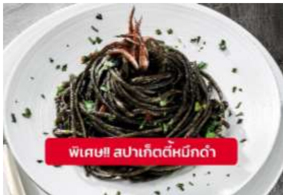
พิเศษ!! สปาเก็ตตี้หมึกดำ

๑๑ รับประทานอาหารเที่ยง (มื้อที่ 9) เมนูพิเศษ!! สปาเก็ตตี้หมึกดำ