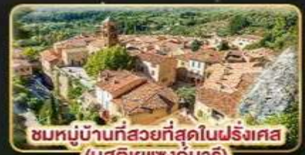
ชมหมู่บ้านที่สวยงามที่สุดในฝรั่งเศส (มูสติเยแซงก์มาร์)