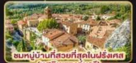
ชมหมู่บ้านที่สวยงามที่สุดในฝรั่งเศส (มูสติเยแซงมาร์)