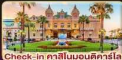
Check-in คาสิโนมอนติคาร์โล