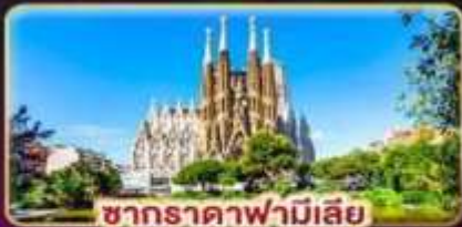
ซากradaฟามีเลีย

สัมผัสเสน่ห์ลาเวนเดอร์ "โปรวองซ์" แห่งฝรั่งเศสใต้