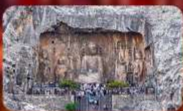
กำแพงหลงเหมิน