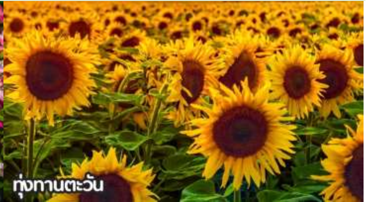
ทุ่งทานตะวัน

จากนั้นนำท่านสู่ ถนนหวังฝูจิ่ง ถนนคนเดินสุดฮิตใจกลางกรุงปักกิ่ง ปัจจุบันถนนนี้เป็นที่นิยมมากในหมู่นักช้อปปิ้งและนักท่องเที่ยวที่ตบเท้าเข้ามาเพื่อเสาะหาของลดราคาและเสื้อผ้าที่มีเอกลักษณ์ไม่ซ้ำใคร ถนนการค้าที่พลุกพล่านแห่งนี้มีมานั่ง บาร์ ร้านอาหาร และคาเฟ่เรียงรายตลอดทางอยู่บนถนนคนเดินสายนี้ ให้ท่านได้ช้อปปิ้งร้าน Pop Mart ที่ใหญ่ที่สุดในปักกิ่งตุ๊กตา box หน้าตาน่ารักที่ดังที่สุดในจีนตอนนี้ ต้องยกให้กับ Pop Mart