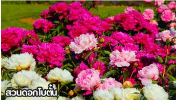
สวนดอกโบตั๋น

เดือนสิงหาคม-ต้นกันยายน ชมทุ่งดอกเบญจมาศหรือดอกไฮเดรนเยีย ดอกเบญจมาศปักกิ่งหมายถึงสายพันธุ์เบญจมาศที่มีต้นกำเนิดหรือนิยมปลูกในกรุงปักกิ่ง ประเทศจีน โดยเฉพาะช่วงฤดูใบไม้ร่วง ที่มีการจัดงานมหกรรมดอกเบญจมาศ แสดงความหลากหลายของสีและรูปร่าง มีสายพันธุ์เช่น "กุสุยจินเสี่ย" ที่ได้รับรางวัลราชาดอกเบญจมาศ และยังมีเบญจมาศปักกิ่งสีขาวที่เป็นสมุนไพรด้วย ที่สำคัญคือเป็นดอกไม้ที่ใช้ในงานเทศกาลและวัฒนธรรม โดยเฉพาะในสวนสาธารณะ เช่น รื่อถาน และอุทยานเป่ย์ไห่ มีหลากหลายสี เช่น ขาว เหลือง ชมพู แดง และม่วง สามารถพบได้ในหลายพื้นที่